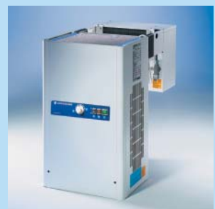
Huckepack-Aggregat mit T-Regelung