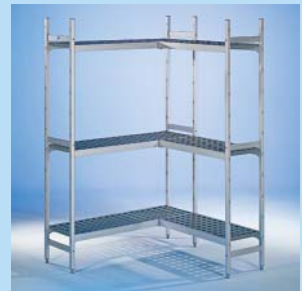
Aluminiumregal Rega Almo